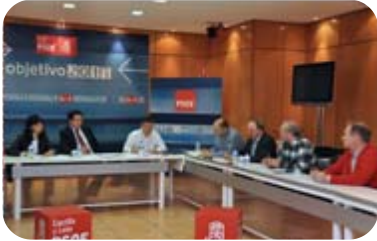
Reunión con el PSOE de Castilla y León