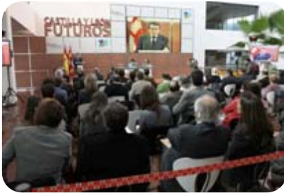
Seminario sobre Población en Castilla y León

Durante el ejercicio 2010 HUEBRA ha participado en los siguientes encuentros, reuniones, seminarios, comités,... organizados desde diferentes organismos pertenecientes a la Junta de Castilla y León: