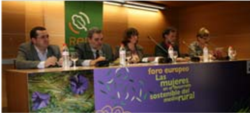
Asamblea General de la REDR

14 diciembre Premios LEADER Círculo de Bellas Artes Madrid