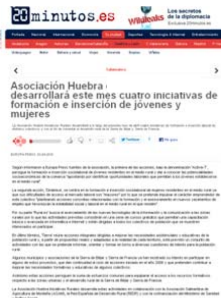
3 de abril de 2010 20 minutos.es

Asociación Huebra desarrollará este mes cuatro iniciativas de formación e inserción de jóvenes y mujeres