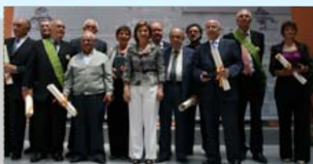
Acto de entrega Placa Mérito Agrario a la REDR

8 junio Reunión con el Jefe de Gabinete de Presidencia Confederación Hidrográfica del Duero (CHD) Valladolid