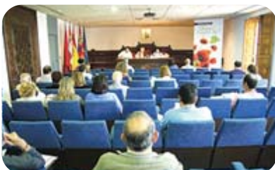
Acto de Constitución Consejo Social Rural “Tierra de Campos Sur”