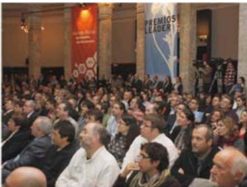
Entrega Premios LEADER Círculo de Bellas Artes