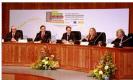
Conferencia Inaugural Año Europeo de Lucha contra la pobreza y la exclusión social

21 enero Participación en la Conferencia Inaugural del “Año Europeo de Lucha contra la pobreza y la exclusión social” Ministerio de Sanidad y Política Social Madrid