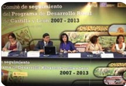
Comité de Seguimiento del PDR Castilla y León