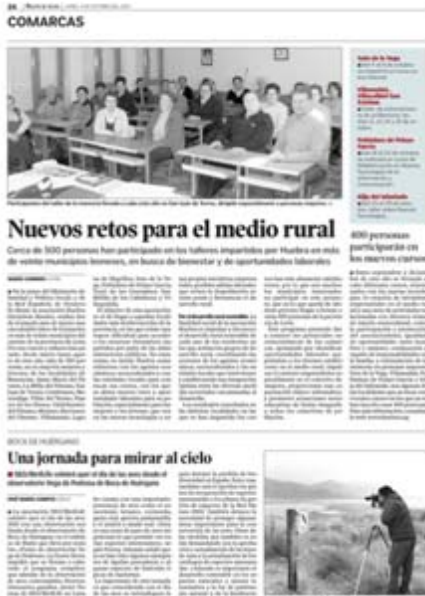
4 de octubre de 2010 Diario de León diariodeleon.es

Continúan los talleres y cursos que impulsan el desarrollo rural